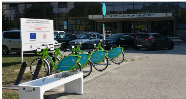
Jedno zo siedmich stanovišť je pred internátom SPU. Momentálne, v čase prázdnin, bicykle využívajú najmä občania.