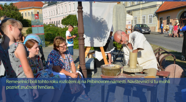
Remeselníci boli tohto roku rozložení aj na Pribinovom námestí. Návštevníci si tu mohli pozrieť zručnosť hrnčiara.