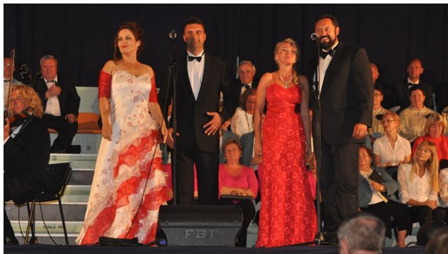
Na benefičnom koncerte Hoj vlast' moja budú účinkovať sólisti SND.