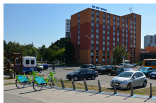
Ďalšie stanovište je pri rieke Nitra, v blízkosti internátu UKF.

Záujemcom o zapožičanie bicykla sa stačí zaregistrovať na stránke arriva.bike alebo prostredníctvom mobilnej aplikácie